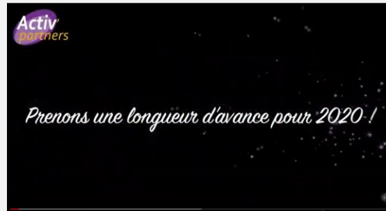
Notre université d'été 2019